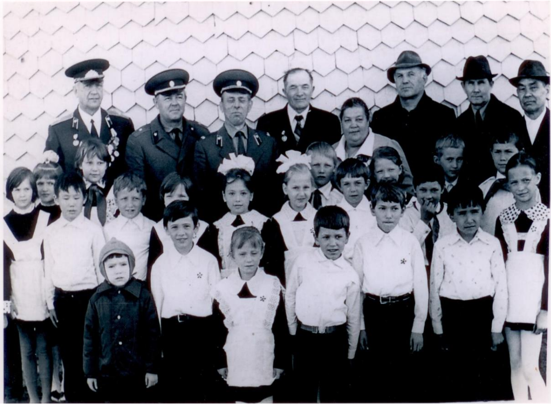
На встрече с плишкинскими школьниками